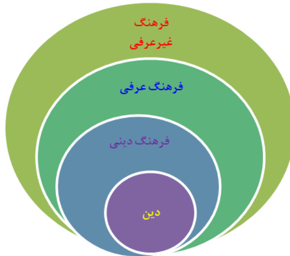
شکل ۲: سلسله مراتب و مرکزیت محتواهای فرهنگی

«فرهنگ ارزش محور علمی» در این سنت فکری، فرآیندی چهاربُعدی است که خود جنبه‌ای دیگر از تفاوت و تمایز آن با اخلاق دانشگاهی شرعی عقیدتی را می‌تواند به ظهور برساند. ترسیم آن در شکل ۳ و تشریح هر بُعد به شرح مطالب پس از شکل است: