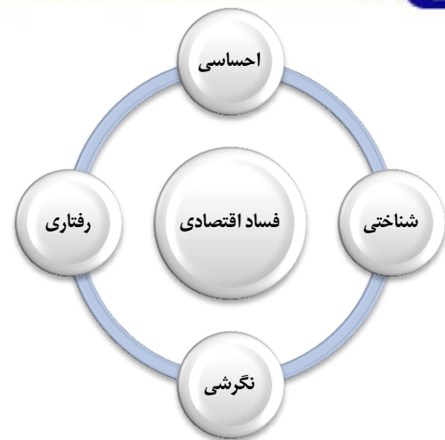
شکل ۱: مؤلفه‌های فساد اقتصادی

در ادامه مقاله شامل چهار بخش می‌شود. ابتدا پیشینه تحقیق بررسی می‌شود. سپس مبانی نظری فساد از دیدگاه اسلام و شاخص‌های کارکردی دین مشخص می‌شود. در قسمت بعد روش تحقیق بیان شده تحلیل آمار توصیفی و آمار استنباطی نتایج ارائه می‌شود و بخش انتهایی نیز جمع‌بندی و پیشنهادات ارائه می‌شود.